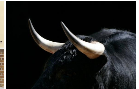
Reses astifinas: Peligro en orificios y huecos