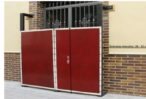
Magnífico ejemplo de Burladero.

La colocación de una chapa metálica lisa, en el frente del tablero, mejora el comportamiento del burladero frente al cabeceo de la res.