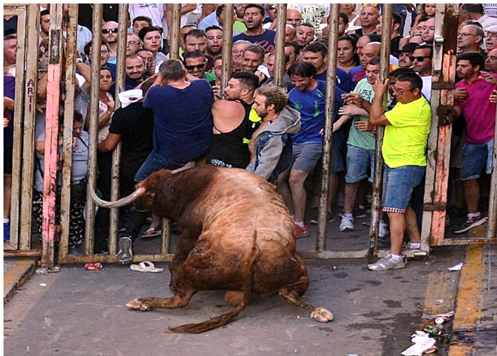
Los espectadores situados tras las barreras verticales deben permitir el refugio a los participantes.

Las barreras verticales, además de impedir la fuga de las reses del ámbito de celebración de los festejos taurinos, deben proporcionar protección a los espectadores y refugio a los participantes .