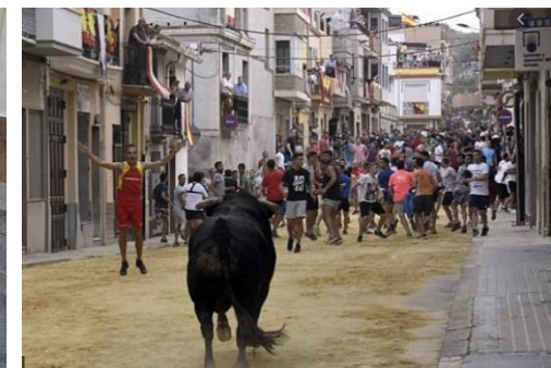
Gran número de participantes.