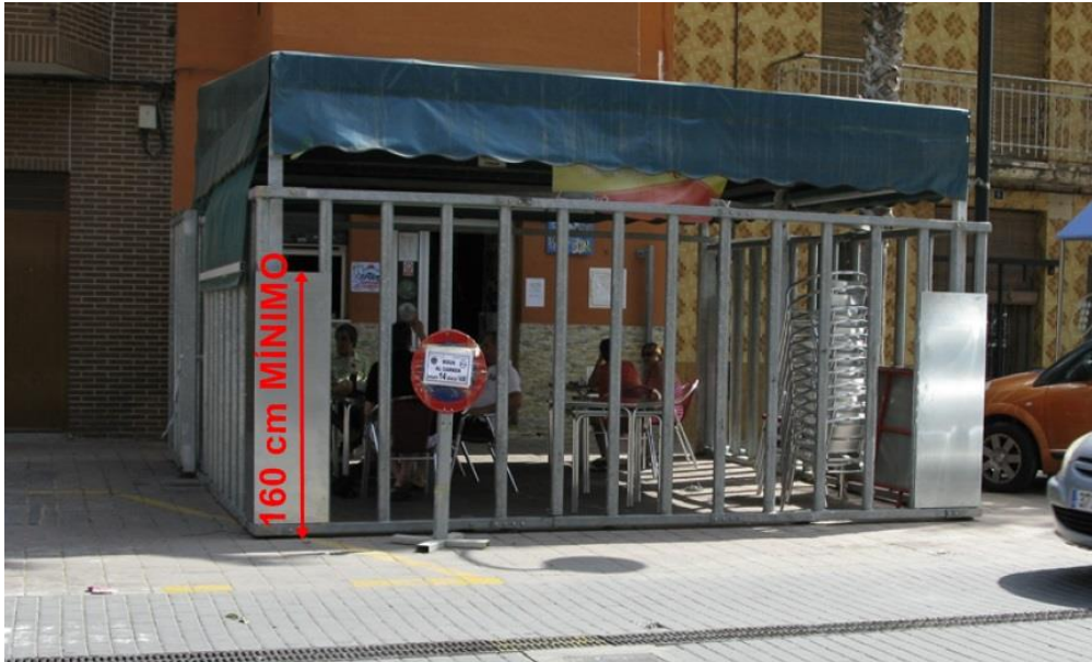
Cadafal con un hueco cegado en cada esquina.

Los huecos entre barrotes colindantes a las esquinas de los cadafales tienen riesgo de colisión entre participantes . Este riesgo se evidencia cuando dos participantes se refugian a la vez , cada uno por uno de los dos huecos de esquina. En caso de colisión, alguno de los dos participantes, o quizás los dos, no podrá introducirse al interior del cadafal, quedando expuesto a la embestida.